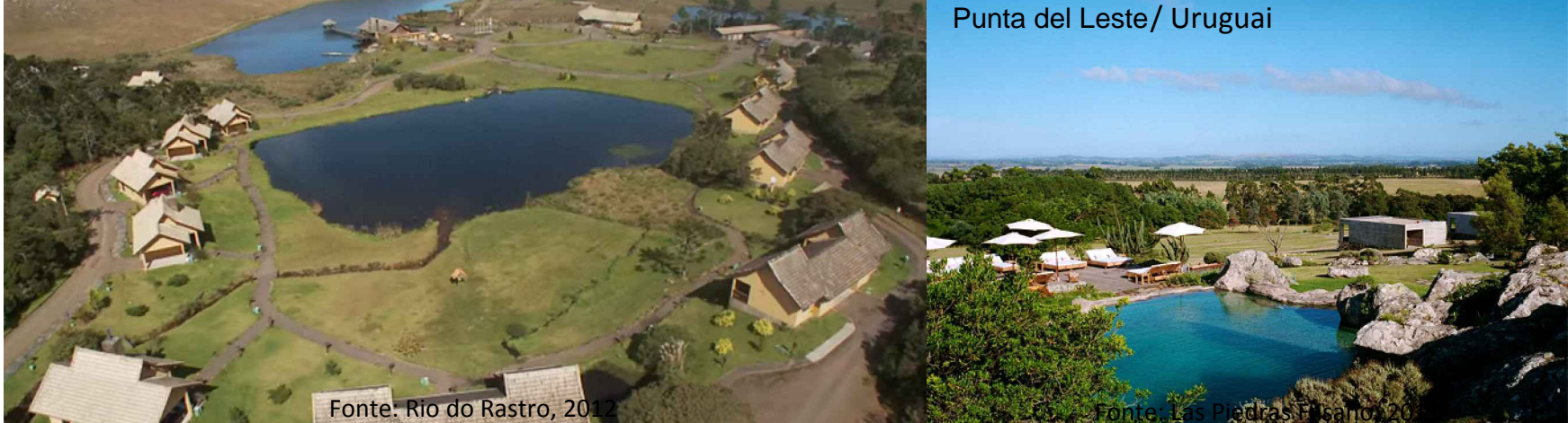
Fasano Las Piedras Resort e Spa- La Barra - Punta del Leste/ Uruguai