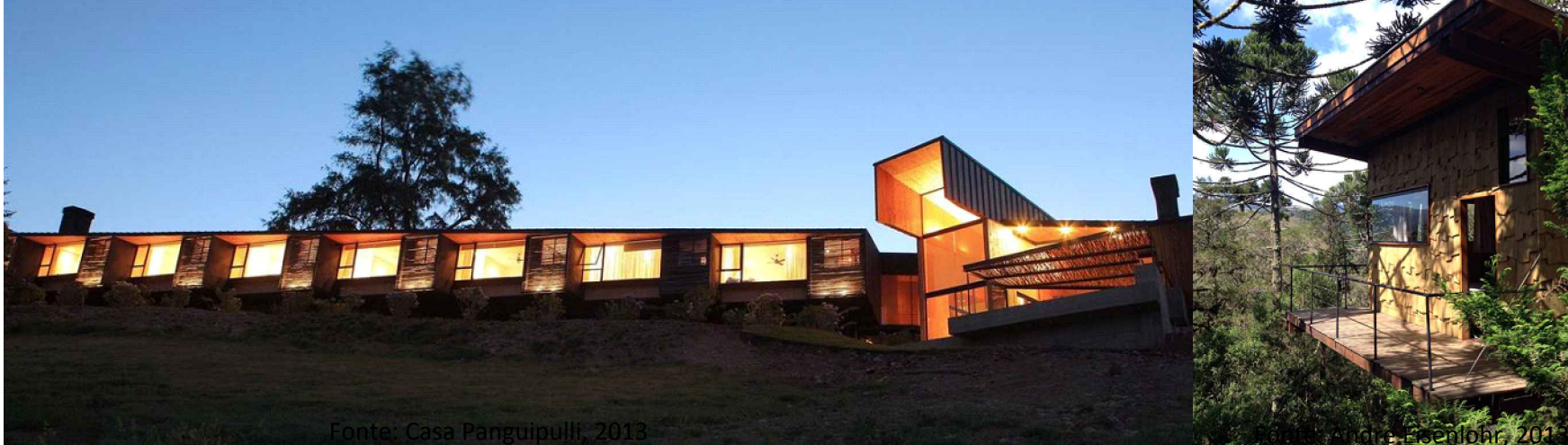
Serra do Rio do Rastro Resort - Bom Jardim da Serra - SC/ Brasil